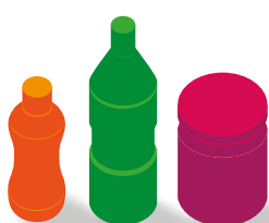
Decorazione a tutto corpo con sigillo di garanzia Full body sleeve with protection seal

Con la nostra macchina possiamo realizzare le seguenti modalità di applicazione sleeve: With our machine we can realize the following modes of sleeve application: