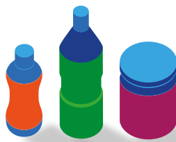
Decorazione di corpo Full body sleeve